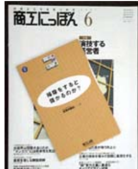
私の記事を無料で差し上げます